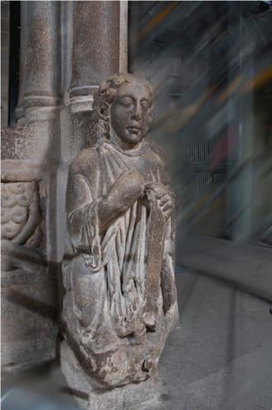
24.- Axeonllado fronte ao altar maior está _____