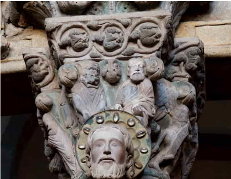
25.- O capitel que completa o parteluz reproduce detalladamente a pasaxe evanxélica das _____